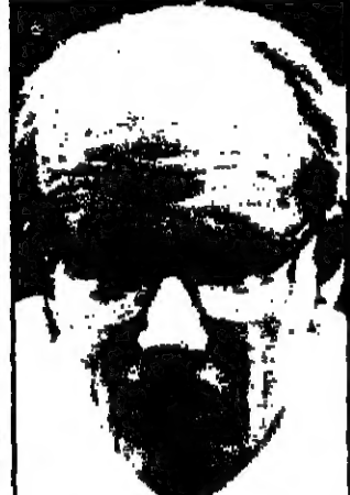
جيس رودري في دور العنصرية